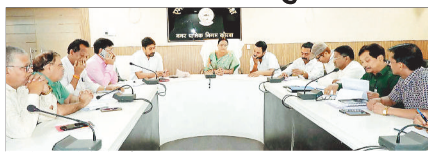
बैठक में अधिकारियों को निर्देश देती महापौर।

महापौर ने आयुक्त की उपस्थिति में जोन कमिश्नर व प्रभारी अधिकारियों की ली बैठक