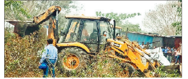
अतिक्रमण पर कार्रवाई करता निगम अमला।