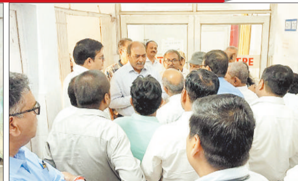
निरीक्षण के दौरान चिकित्सक व स्टाफ से चर्चा करते बोर्ड के सदस्य।