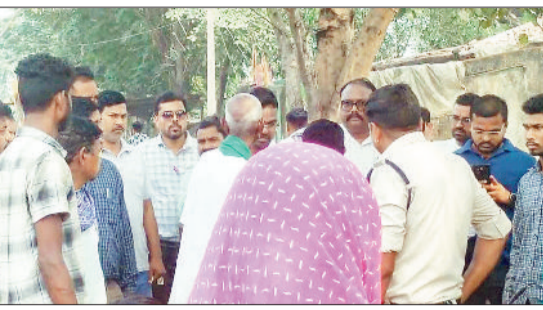
आक्रोशित ग्रामीणों को समाझाए देते प्रशासनिक अधिकारी।