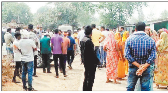
एसईसीएल व प्रशासन की टीम का विरोध करते ग्रामीण।

उल्लेखनीय है कि अधिग्रहित ग्राम मलगांव एसईसीएल दीपका प्रबंधन व खदान में नियोजित कंपनी कर्मियों के लिए अब सिरदर्द बन गया है। कर्मियों की ओबी और कोयला उत्खनन का दोनों काम अभी आमगांव दरा खांचा साईड में कर रहे हैं जो अब नाकाफी है खदान विस्तार व कंपनी को चलाने के लिए और बड़ी जमीन की जरूरत है, इसी को ध्यान में रखते हुए प्रशासन व कंपनी के अधिकारी, कर्मचारी