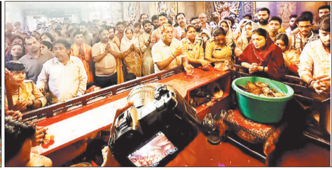
सर्वमंगला मंदिर में जुटी श्रद्धालुओं की भीड़।