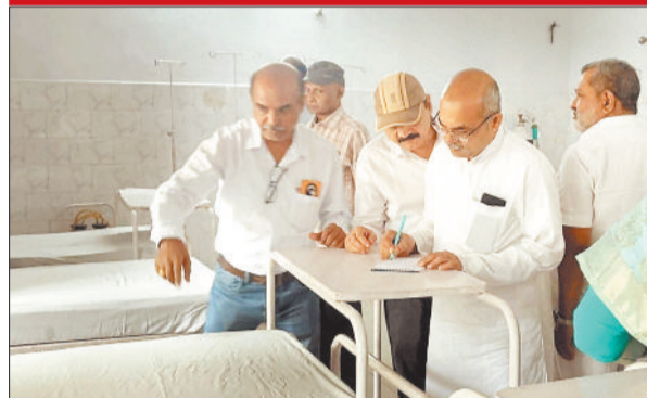
अस्पताल के वार्ड का निरीक्षण करते वेलफेयर बोर्ड के सदस्य।

एसईसीएल प्रबंधन ने खामियों को जल्द दूर करने दिया आश्वासन