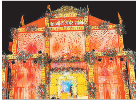
कटघोरा में निर्मित मातारानी का भव्य पंडाल।

चैत्र नवरात्र महासाप्तमी के अवसर पर अलसुबह से ही सर्वमंगला मंदिर, मड़वारा, चेतुरगढ़ सहित अन्य देवी मंदिरों में भक्तों की भारी भीड़ लगी हुई थी। जहां सुबह से देर रात तक श्रद्धालु मातारानी के दर्शन के लिए पहुंचते रहे तो वहीं दूसरी ओर सर्वमंगला मंदिर में अलसुबह मातारानी का महाश्रृंगार किया गया था। साथ ही 56 भोग लगाया गया था जिसे देखने के लिए भारी